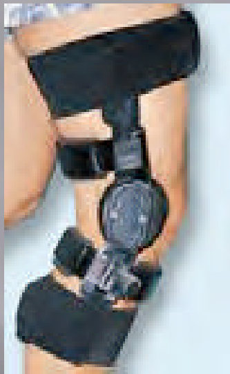
Orthèse de genou de série