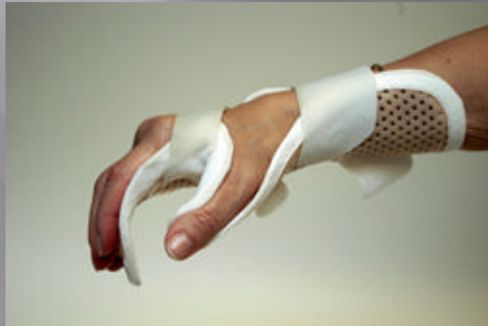
Orthèses de main