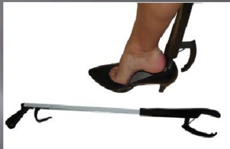
Pince à long manche chausse pied