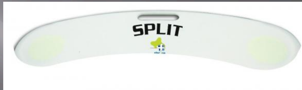
Planche de transfert