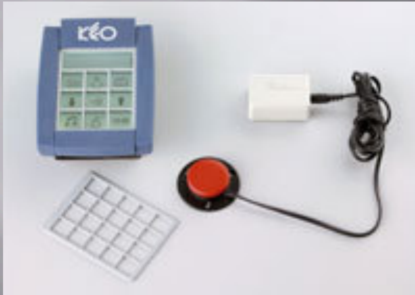
KEO: appareil de contrôle de l'environnement