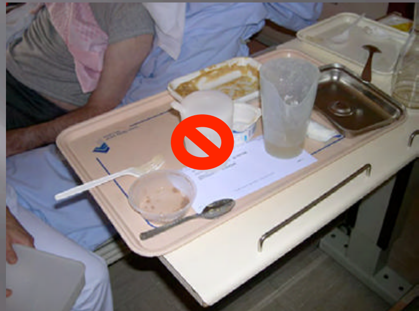
Verres avec encoche nasale