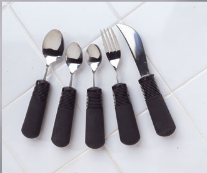
Couverts lestés ou à manche grossis