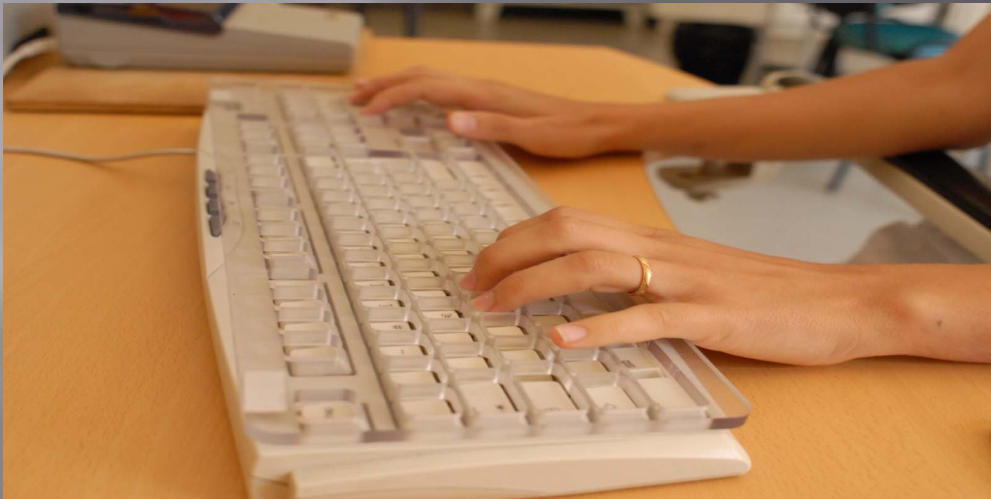
Clavier Guide doigts