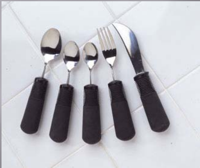
Couverts lestés ou à manche grossis