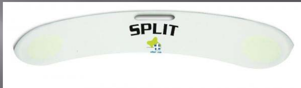
Planche de transfert