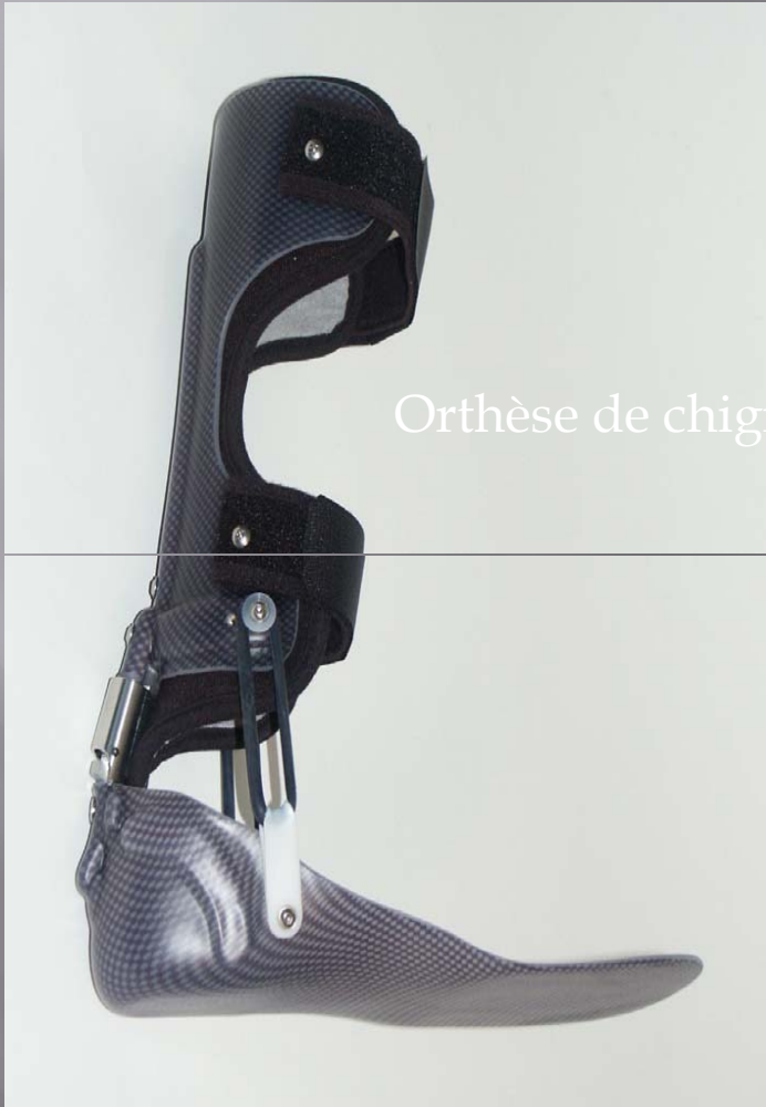
Orthèse de chignon