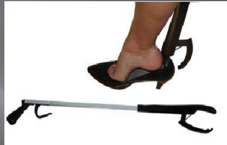
Pince à long manche chausse pied