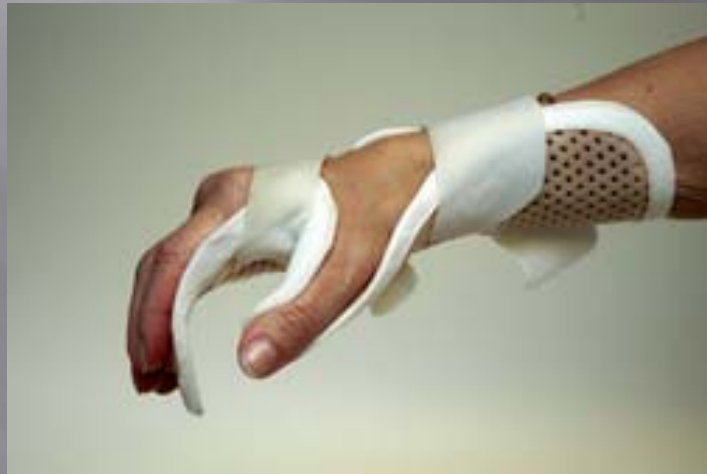
Orthèses de main