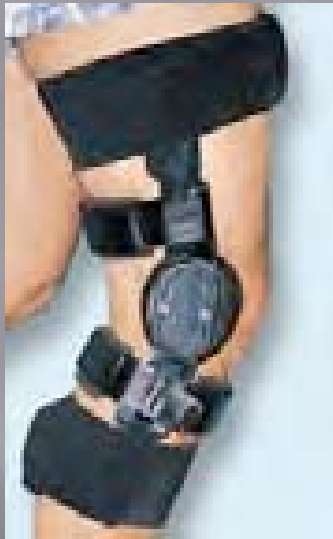
Orthèse de genou de série