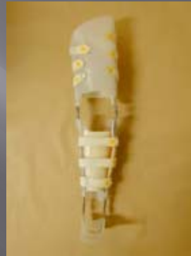
Cruro-pédieuse sur mesure