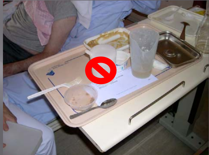
Verres avec encoche nasale