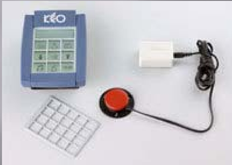
KEO: appareil de contrôle de l'environnement